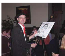
Le caricaturiste à l'œuvre dessinant les invités dans des situations loufoques

Quoi de mieux pour conclure un congrès des plus fructueux qu'un banquet de clôture des plus animés sous le thème du Mardi Gras de la Nouvelle-Orléans! Et croyez-en les congressistes, la soirée a été mémorable! Body-painting, homme orchestre, caricaturiste, échassier et chorale Gospel ont su retenir l'attention des participants. Le tout a été complété par un orchestre de huit musiciens de talent pour animer une soirée de danse remarquable. Bref, une soirée inoubliable!!!